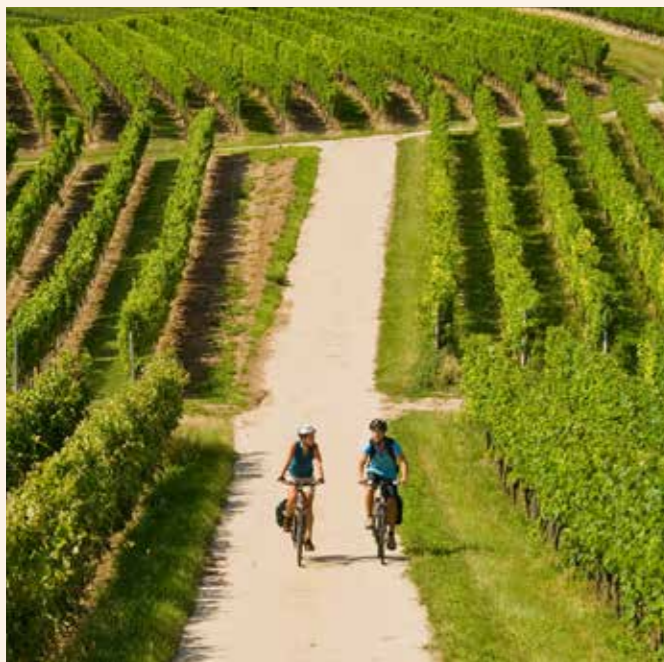
Heerlijke fietsvakanties in Rheinhessen