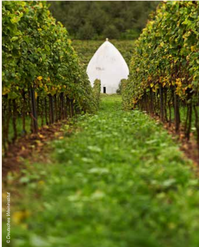
Voorbeelden van trulli in Rheinhessen