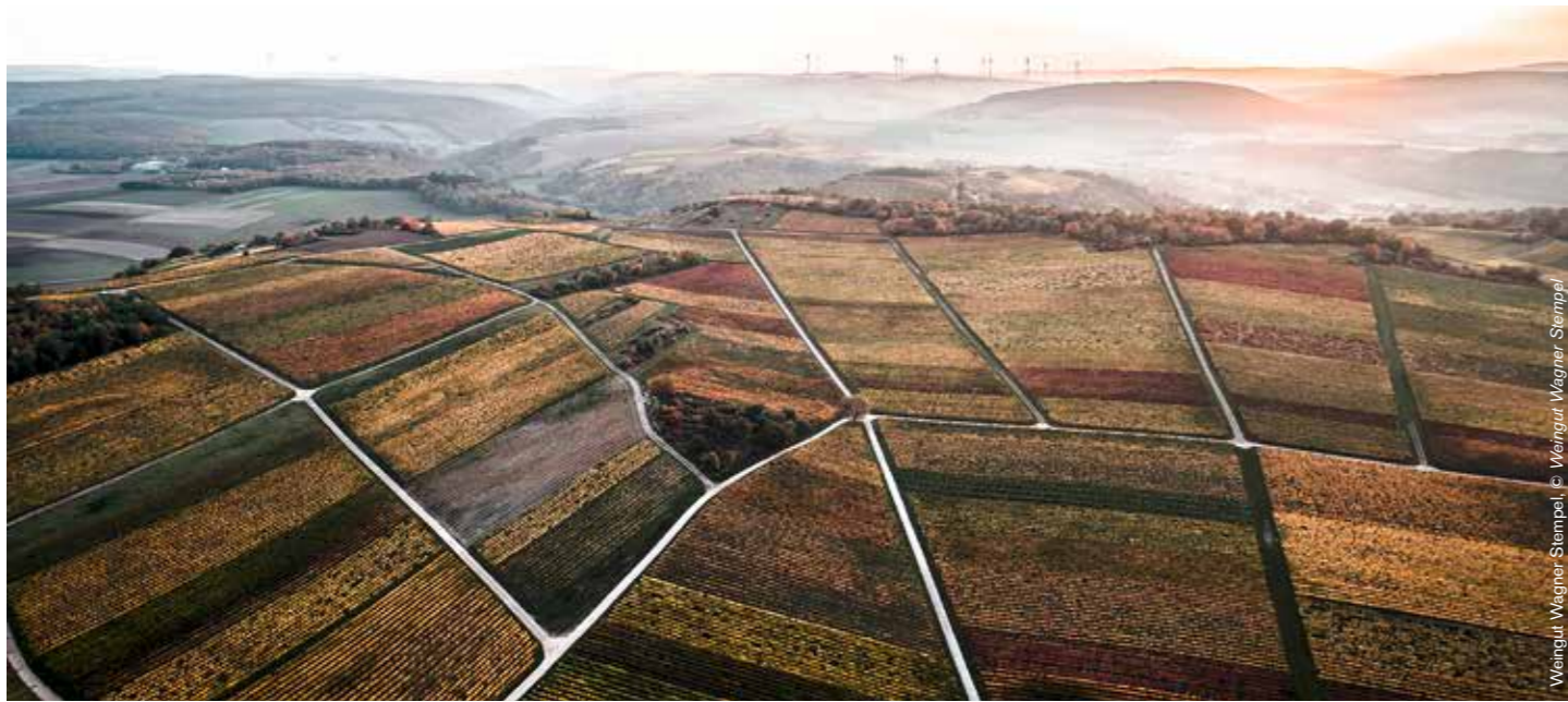
Wijngaarden van Siefersheim

Zo is er door de hoogteverschillen duidelijk invloed op de temperatuur. In Rheinhessen liggen de wijngaarden tussen 80 en 300 m. De hoogst gelegen wijngaarden vind je rond Siefersheim, tussen Alzey en Osthofen, rond Appenheim, Gau-Algesheim en Ingelheim. Wijnen uit en rond deze locaties zijn preciezer, fris en tonen duidelijk spanning. De Siefersheimer Heerkretz (porfier) en Dittelsheimer Kloppberg (kalk en klei-mergel) zijn met een hoogte tot 280 m de hoogst gelegen Grosse Lagen van Rheinhessen. Proef maar eens de Riesling Heerkretz GG van Wagner-Stempel. Messcherpe wijn, geen genade voor vetzigheid, rechtlijnig en ellenlang. Puristische wijn op Duitslands hoogste niveau. De Kloppberg GG van Weingut Winter is dan weer een combinatie van fijne kracht, structuur en heerlijke frisheid. Een op en top kalkwijn. Op de hoger gelegen wijngaarden in het noorden zien we een heropleving van burgunderrassen. De combinatie van kalk en een koeler microklimaat maakt dat hier het ene toptalent na het andere zich ontpopt.